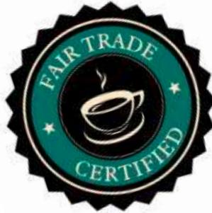
Fair-Trade-Produkte Umsatz in Mio. Euro

Das Gesundheits- und Qualitätsbewusstsein der Konsumenten steigt: Das gilt vor allem auch für ältere Kunden, die zudem immer mehr werden. Dabei liegen zunehmend elegante