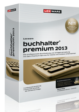
Lexware buchhalter premium

Einzelversion Preis: € 499,00 Update Preis: € 349,00