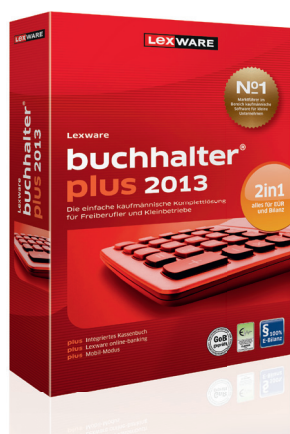
Lexware buchhalter plus

Einzelversion Preis: € 169,90 Update Preis: € 129,90